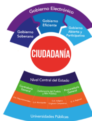
Gráfico Nro. 2: Esquema general y visión de Gobierno Electrónico