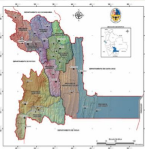
IMAGEN N° 1 Provincias Chuquisaca

Se puede considerar los Límites Territoriales como instrumentos de planificación que definen qué usos deberá destinarse el suelo ocupado por el territorio, con qué intensidad y en qué condiciones y circunstancias de todo tipo, grado de urbanización, volumen, estético, medioambiental, plazo de realización y financiación que cumple su planificación territorial.