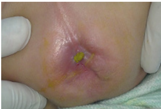
Fig. 2 (Estenosis Anal)