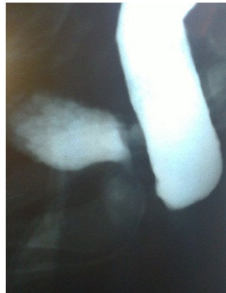
Fig. 10 (Cistourethrografia – colostograma distal sin fistula)