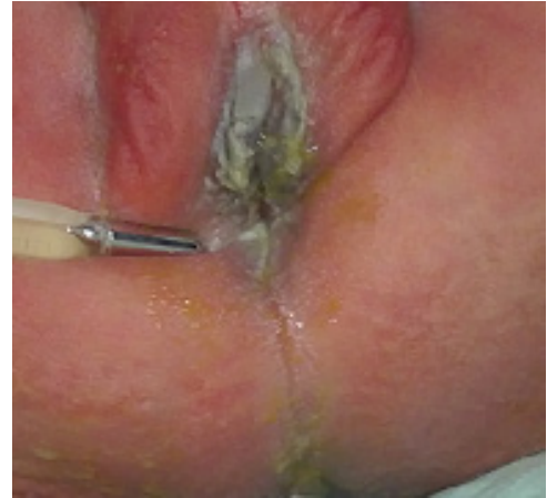
Fig. 8 (Cloaca)