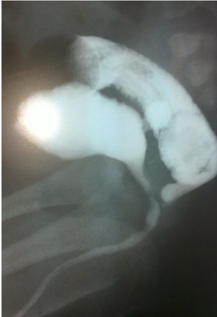
Fig. 11 ( Cistouretrografía – Colostograma distal con fistula)