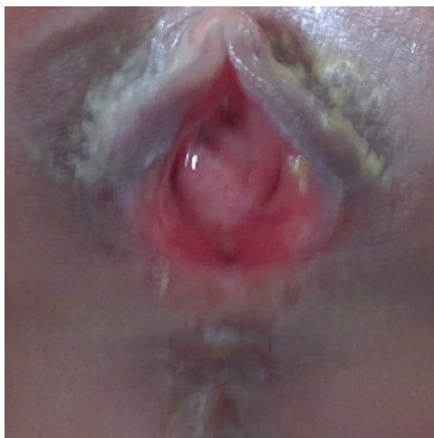
Fig. 7 (Fistula recto vestibular)