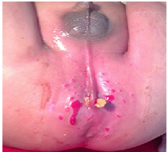
Fig. 3 (Asa de cubeta)