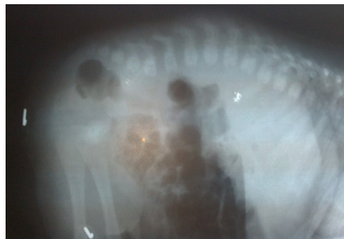
Fig. 9 (Invertograma, distancia intestino piel > 1 cm)