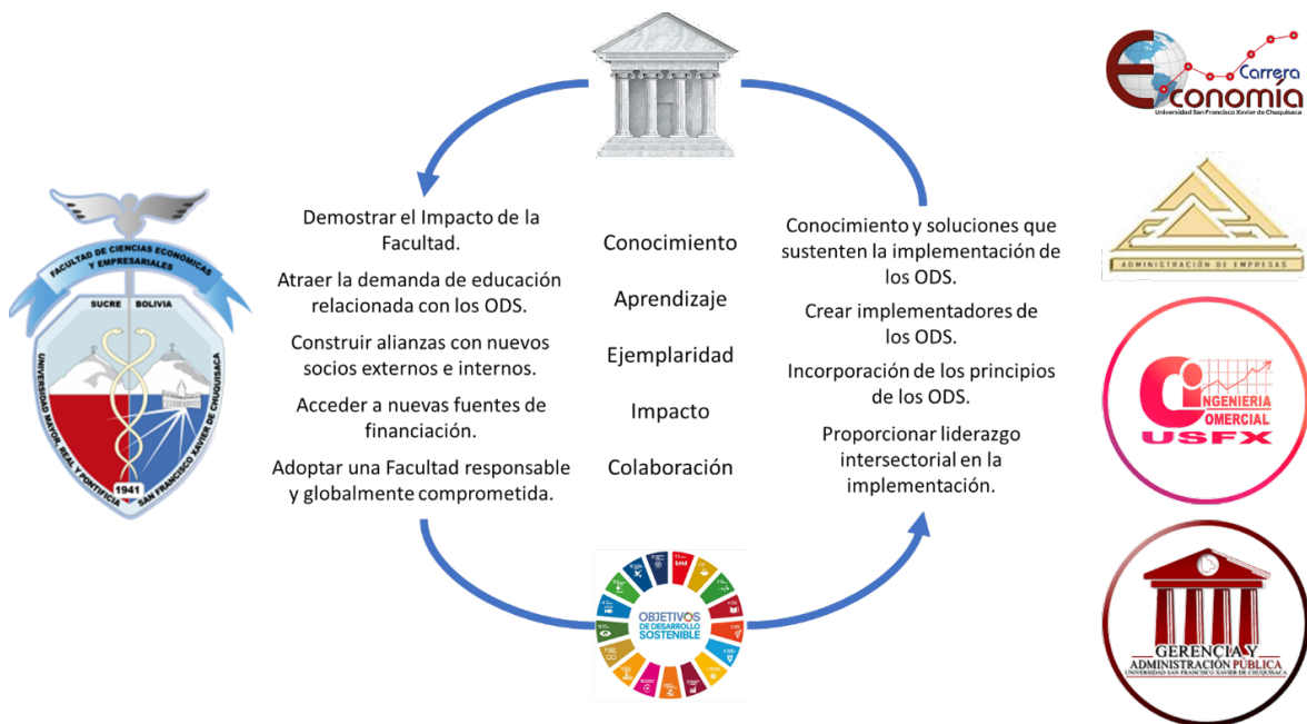
Figura N° 2.- Compromiso facultad de ciencias económicas y empresariales con los objetivos de desarrollo sostenible (ods)