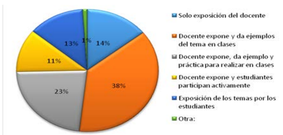
Gráfico 5 Tipo de clase en aula