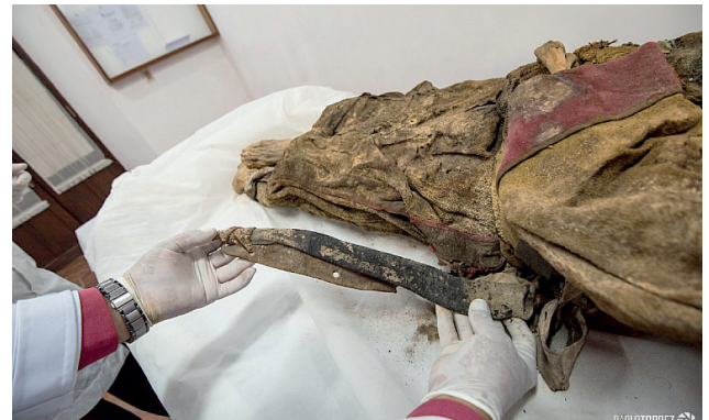
Fotografía N° 5: Estuche porta bayoneta de armas de la época y cartuchos alineados y sujetos contra el abdomen por medio de una especie de faja.

A nivel de la parte lateral izquierda de la cadera y del muslo se encuentra un estuche de cuero longitudinal de 40 cm de longitud, de color negruzco, envejecido, correspondiente a un portabayoneta, relacionado con las armas de la época. (Fot. N° 5)