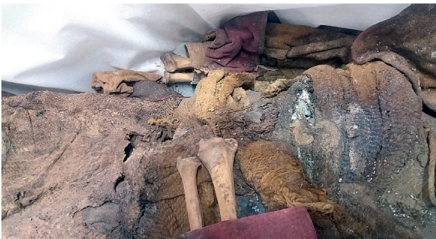
Fotografía N° 3

Por debajo, se encuentra una camisa decolorada, de color parduzca, de la cual solo se puede observar el cuello, estando oculto el resto por la chaqueta que está adherida a la misma.