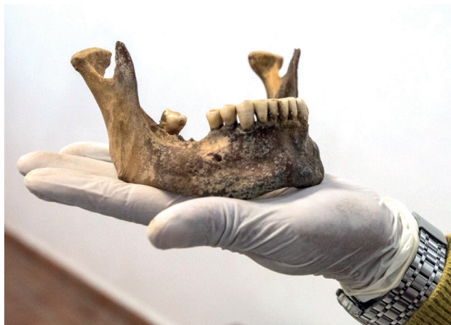
Fotografías 14 y 15: Dentadura en buen estado de conservación y mandíbula

El resto del cuerpo se encuentra con áreas de momificación y corificación, a expensas de tórax y abdomen y tan solo se puede efectuar una apreciación táctil y no visual, debido a la presencia de la vestimenta.