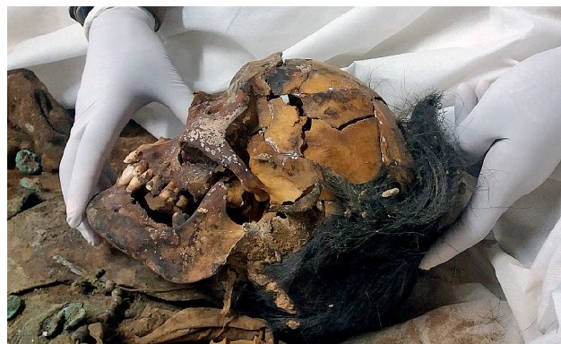
Fotografías 16 y 17: Vistas laterales de los huesos del cráneo y la cara, donde se aprecia fracturas multifragmentarias de la bóveda que fueron reconstruidas inicialmente por los expertos peruanos

A nivel de extremidades inferiores, se observa en primera instancia, el desprendimiento completo de la pierna derecha a nivel de la unión del tercio medio con el tercio superior, donde también se aprecia la existencia de una fractura doble de tibia y peroné, en pico de flauta, con pérdida de tejido óseo de aspecto circular en la cara externa de la tibia, cuya causa se