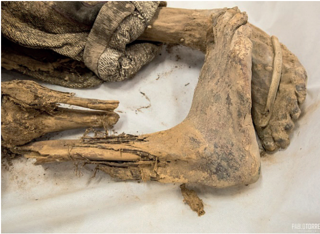
Fotografía N° 11: Tira de cuero, correspondiente a segmento de una abarca

Examen cadavérico.- Los fenómenos cadavéricos correspondientes a este cuerpo están representados por una esqueletización completa de la cabeza, con áreas cubiertas por cuero cabelludo completamente desecado, adherido parcialmente al plano óseo, en la región occipital. Los huesos de la cara, se encuentran conservados. (Fot. 12 y 13)