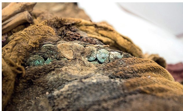
Fotografía N° 8: Balas de fusil, alineadas y sujetas contra el abdomen por medio de una especie de una faja

A nivel de tórax y abdomen se encuentra una especie de faja o mantilla de lana, de trama gruesa, de coloración beige, que contornea al tórax y abdomen. Debajo de dicha prenda, a nivel abdominal, y contenidos por la misma, se encuentra una bolsa pequeña de tela conteniendo varias hojas de coca y así también se encuentran varios cartuchos o balas de fusil alineados y sujetos firmemente contra el cuerpo, cual si estuvieran contenidos en un estuche, los mismos se encuentran oxidados y enmohecidos por el tiempo. (Fot.N° 8)