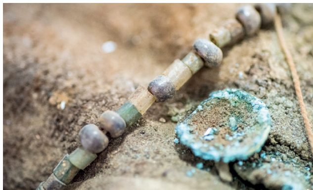
Fotografías N° 6 y 7: Crucifijo con cruz latina y un rosario con cuentas multicolores

A nivel de tórax y abdomen se encuentra una especie de faja o mantilla de lana, de trama gruesa, de coloración beige, que contornea al tórax y abdomen. Debajo de dicha prenda, a nivel abdominal, y contenidos por la misma, se encuentra una bolsa pequeña de tela conteniendo varias hojas de coca y así también se encuentran varios cartuchos o balas de fusil alineados y sujetos firmemente contra el cuerpo, cual si estuvieran contenidos en un estuche, los mismos se encuentran oxidados y enmohecidos por el tiempo. (Fot.N° 8)