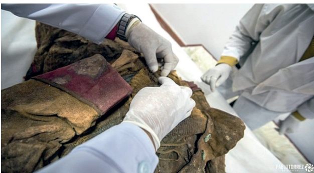
Fotografía N° 4: Caracteres distintivos de tipo militar en la vestimenta del cadáver número uno.

A nivel de la cintura, lleva un cinturón de cuero, que se conecta con otro más ancho, a nivel de abdomen y tórax, en forma oblicua, en bandolera, formando todo esto en su conjunto parte del correaje, el mismo que se encuentra reseca y algo deteriorado por el transcurso del tiempo.