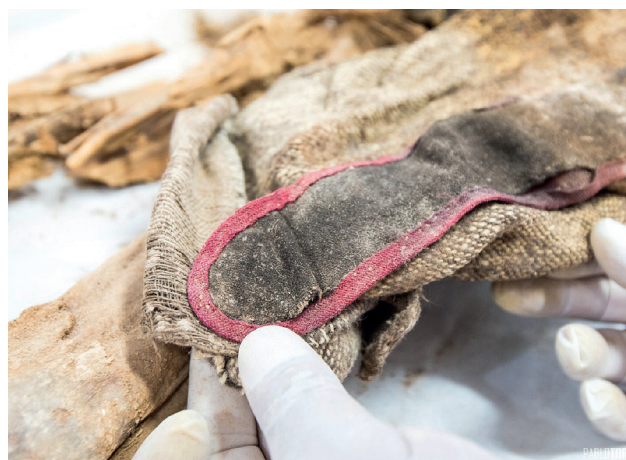
Fotografías 9 y 10: Caracteres distintivos de tipo militar en la vestimenta del cadáver número uno

Es así mismo importante describir que el pantalón se encuentra remangado en ambos lados, desde su extremo distal hasta la unión del tercio inferior con el tercio medio de la pierna, aspecto que constituye también una característica histórica que tenían los soldados bolivianos del Regimiento Sucre en esa contienda.