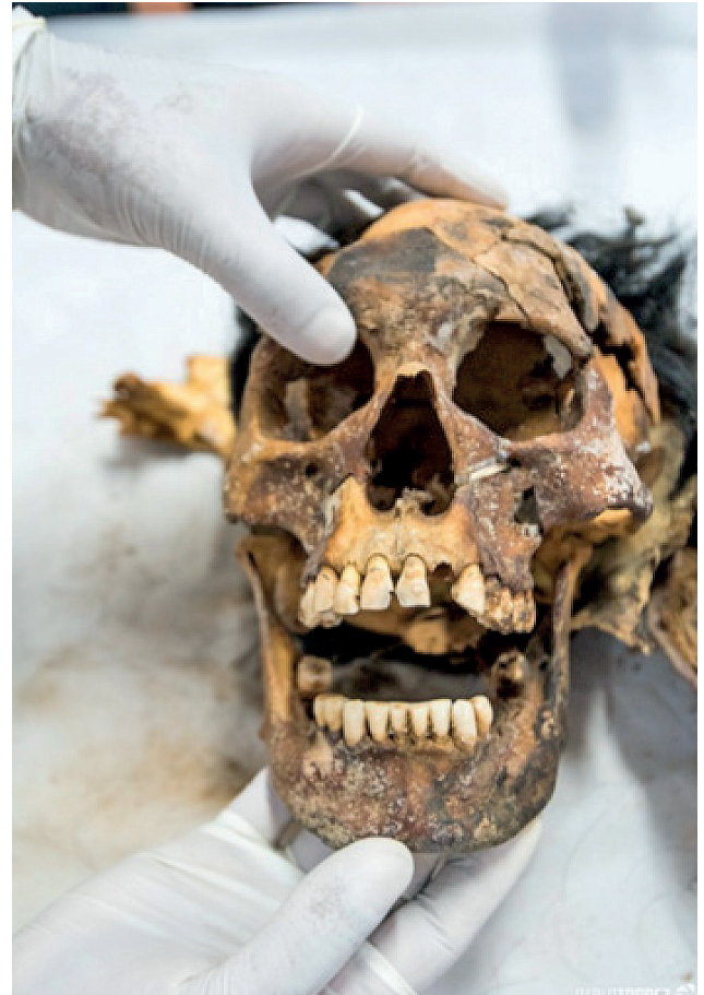
Fotografías 12 y 13: Cabeza esqueletizada, con fracturas múltiples en bóveda craneal y dentadura casi completa, en buen estado de conservación.

Examen cadavérico.- Los fenómenos cadavéricos correspondientes a este cuerpo están representados por una esqueletización completa de la cabeza, con áreas cubiertas por cuero cabelludo completamente desecado, adherido parcialmente al plano óseo, en la región occipital. Los huesos de la cara, se encuentran conservados. (Fot. 12 y 13)